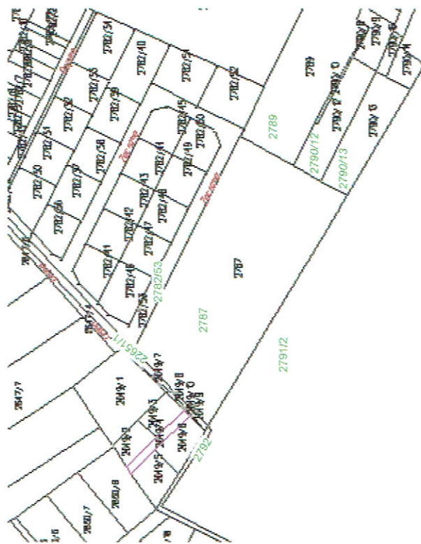
WYNIESIENIE SKALA 1 : 2000

Niniejszy dokument służy za podstawę wpisu do Księgi Wzruszającej Słownictwo do art. 21 ustawy z dnia 17 maja 1939 r. Prawo deodczytyn i katodograficzne.